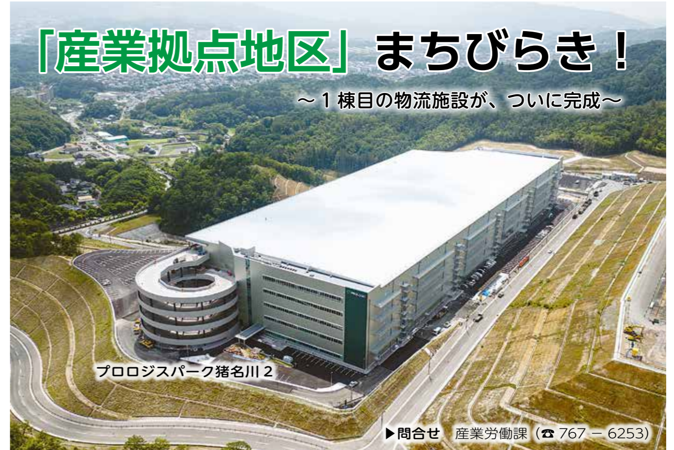
プロロジスパーク猪名川2