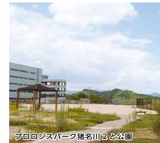
プロロジスパーク猪名川2と公園

プロロジスパーク猪名川2 完成 新名神高速道路・川西ICから、西へ2kmに位置する「産業拠点地区」で建設が進められている大型物流施設「プロロジスパーク猪名川」は、11月末の全棟完成に向け着々と工事が行われています。 この度、8月に「プロロジスパーク猪名川2」が完成し、10月頃より順次稼働します。 また、働く皆さんの通勤手段のひとつとして、川西能勢口駅とプロロジスパーク間を阪急バスが運行(10月予定)します。 ◆プロロジスパーク猪名川2に入居予定の企業(株)ビバホーム、(株)日立物流西日本、エレコム(株)